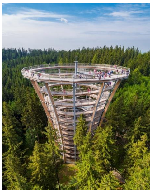
8. října – výlet Janské Lázně Stezka korunami stromů